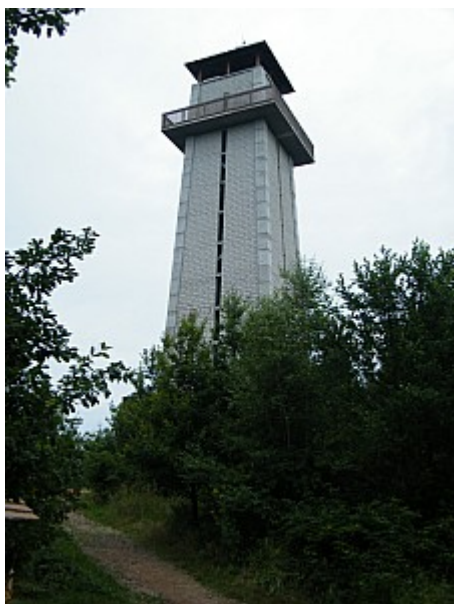
01 rozhledna Klucanina