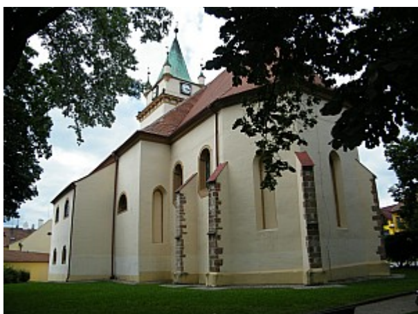
05 kostel sv. Václava v Tišnově