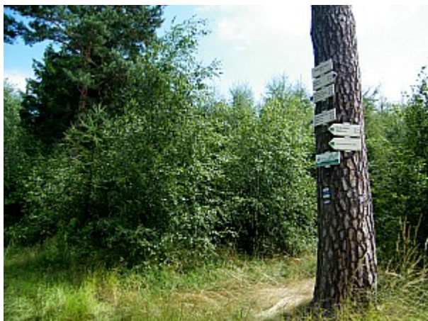
03 rozcestník Nad Díly