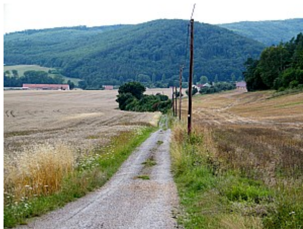
04 cesta do Šerkovic