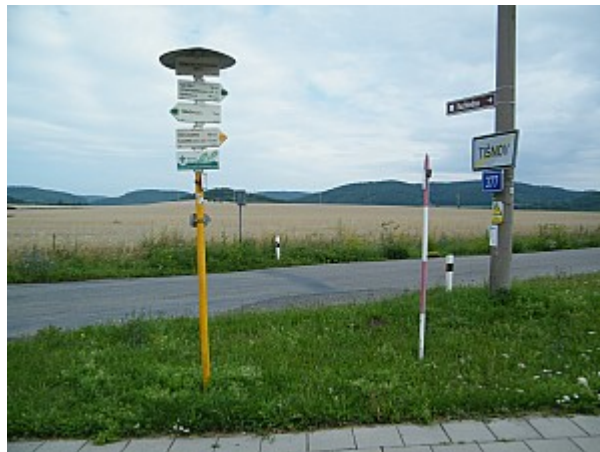
02 turistické informační místo